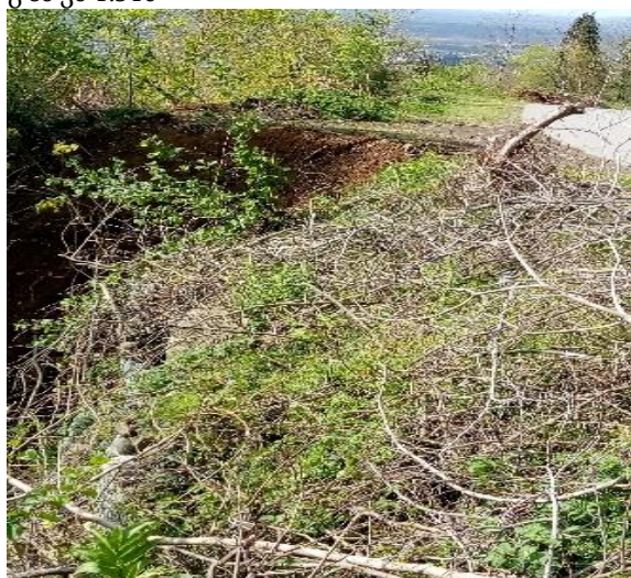
გზა კმ 2.545