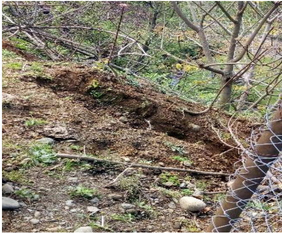
გზის კმ 5.355