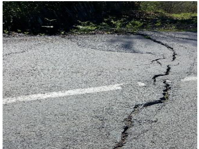
გზის კმ 13.160