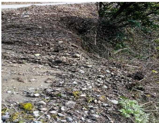
გზა კმ 2.880