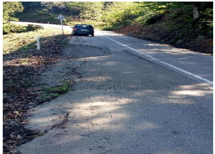
გზის კმ 11.235