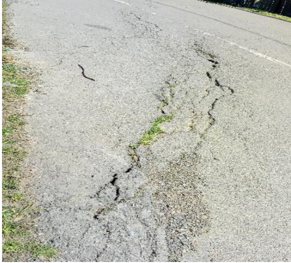
გზა კმ 13.680