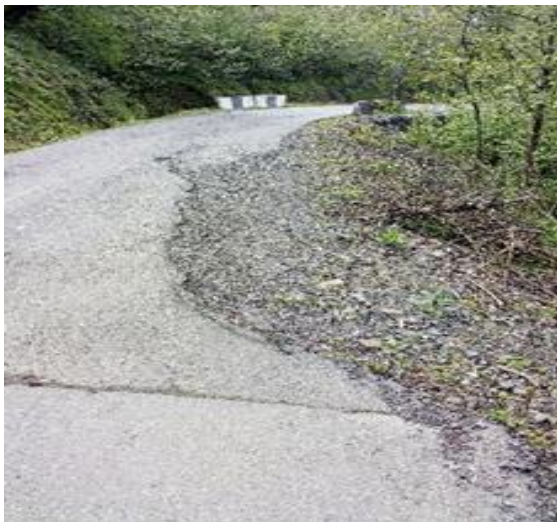
გზა კმ 1.510