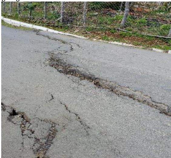
გზის კმ 5.490