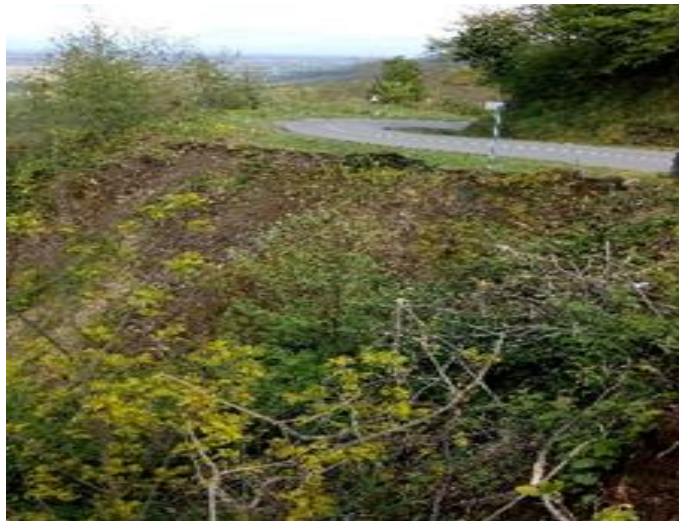
გზა კმ 2.080