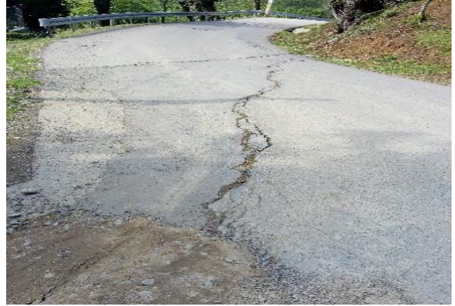
გზის კმ 5.410