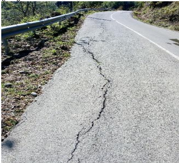
გზის კმ 12.230